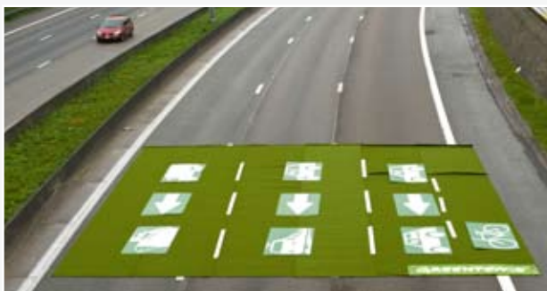
Met dit grastapijt kloeg Greenpeace eerder al het gebrekkige verkeersbeleid voor de Ring rond Brussel aan.