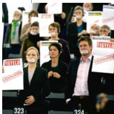
Europese parlementsleden laten de Hongaarse premier Viktor Orban verstaan dat ze geen pap lusten van de nieuwe perswet die in zijn land is ingevoerd. De wet bepaalt onder meer sancties voor media en journalisten die 'niet evenwichtig' berichten over politieke of maatschappelijke kwesties.