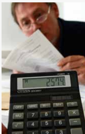
Auteursrechten moeten dit jaar hoe dan ook worden aangegeven.

nog tijd tot 16 oktober om je aangifte bij de fiscus binnen te brengen.