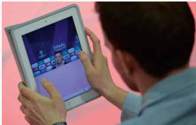
De toename van de digitale abonnees mildert de terugval van de krantenverkoop.

het om + 227%, voor Het Nieuwsblad om + 164% en voor De Morgen om + 45%.