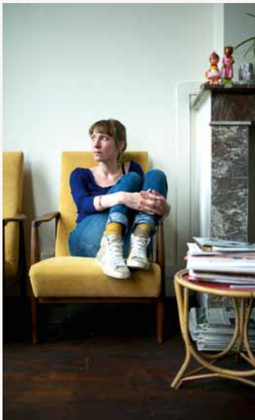
'Journalistiek geeft structuur aan mijn leven.'

Er zit duidelijk een gelukkige filosofe tegenover mij. Dat ligt misschien ook aan haar passies en hobby's? "Oei, da's nogal wat. Nog altijd heel veel lezen, yoga, lopen, snuisterijen verzamelen, rommelmarkten afdweilen, mijn interieur volpropfen... Ik ben al vaak verhuisd. Telkens moet ik met pijn in het hart spulletjes weggooiden om wat nieuwe zuurstof te creëren. Lijstjes maken, dat helpt, al zal dat wellicht een raar psychologisch trekje zijn zeker?"