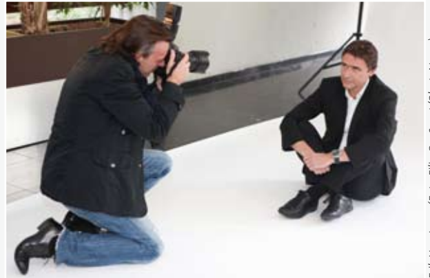
Erik Van Looy

Voor hij de presentator van De slimste mens ter wereld werd, was Erik Van Looy filmjournalist. Die smaak kreeg hij al op de middelbare school te pakken: "Daar stak ik een eigen film-tijdschriftje in elkaar, Film-Info , dat ik ook helemaal zelf vol