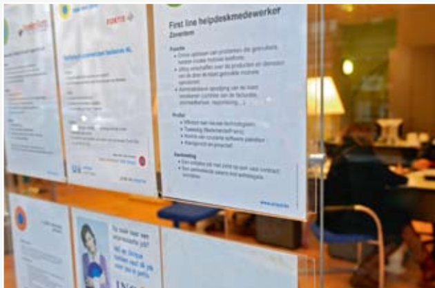
Meer en meer Vlaamse journalisten moeten voor hun job bij een uitzendkantoor langs.

Voor de VVJ is het alternatief duidelijk: een gewone arbeidsovereenkomst voor elke vast aan een redactie verbonden journalist.