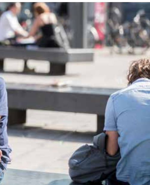
© Steve Thielemans, Lieven Van Assche