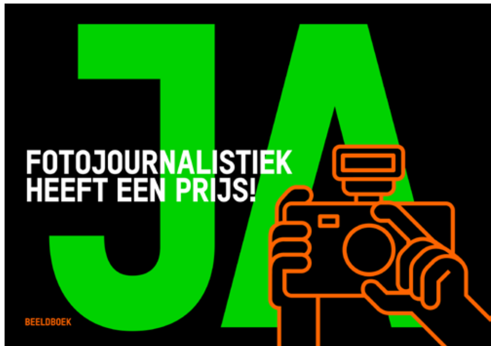
Het campagnebeeld van de Nederlandse Vereniging van Journalisten.

‘We gaan een dag op zwart’, klonk het bij de Nederlandse Vereniging van Journalisten, die de protesten leidt. Volgens de NVJ dreigt fotojournalistiek over tien jaar enkel nog voor hobbyisten haalbaar te zijn. Op de protestdag leverden de journalisten geen foto's aan media of beeldbanken. De fotografen eisten op deze manier hogere en leefbare tarieven. Daarnaast willen ze een indexering met 14% als inflatiecorrectie vanaf 2010 en zeggenschap over auteursrechten.