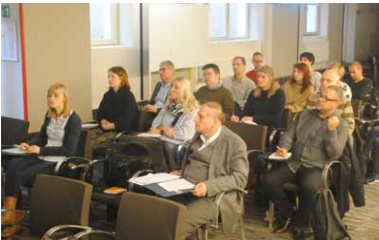
In november 2017 organiseerde de VVJ een infodag voor freelancejournalisten.

De VVJ besteedde ook aandacht aan de verhouding tussen berichtgeving en de aanhoudende terrorismedreiging . Op 15 maart werd hierover een debat georganiseerd in het Vlaams Parlement. Verontrustend was nog een voorstel van zowel parlementsleden als justitiefunctionarissen om naar Brits voorbeeld een comité op te richten, paritair samengesteld uit vertegenwoordigers van politie- en inlichtingendiensten enerzijds en journalisten anderzijds, dat nieuwsmedia zou adviseren over de legaliteit of de opportuniteit van het uitbrengen van informatie met een veiligheidsaspect. De VVJ/AVBB tekende alvast groot voorbehoud aan.