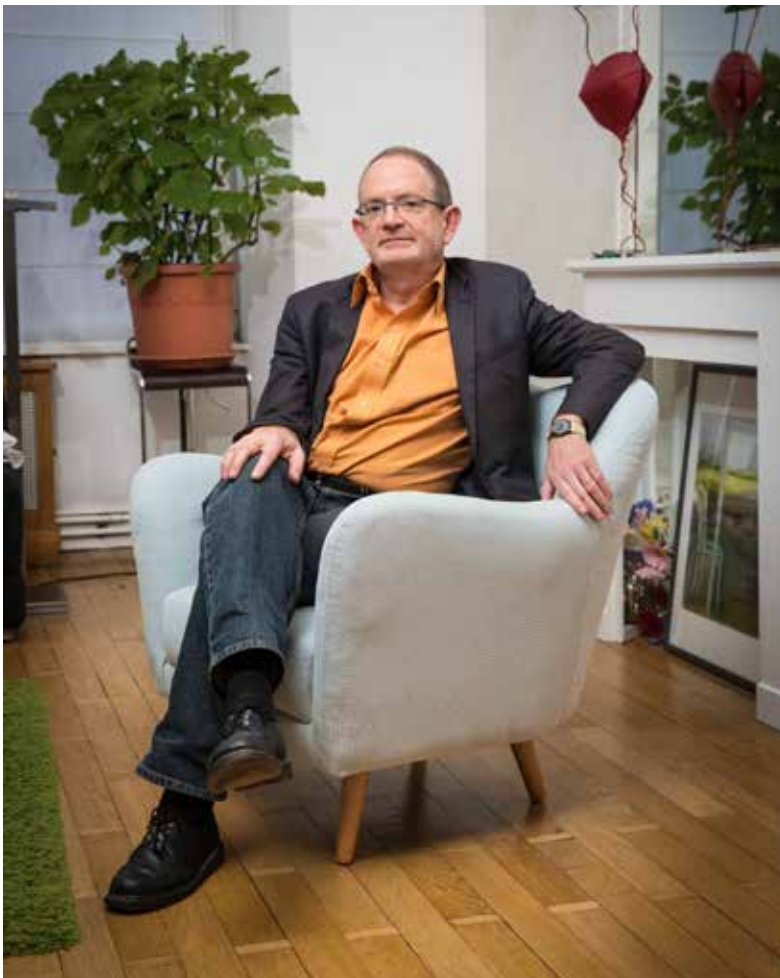
'Journalisten moeten onbevooroordeeld nieuwsgierig zijn en mensen niet corrigeren of veroordelen als ze iets zeggen dat niet in hun kraam past.'

'Ik zou op mijn grafsteen graag zien staan Het was niet gemakkelijk . Het leven is toch een beetje een strijd waarbij je je soms afvraagt: oh boy , waarom overkomt mij dit? Mijn lijfspreuk is wel: luctor sed emergo , ik vecht, ik verdrink bijna, maar ik overwin. Ik denk wel vaak: had ik dat geweten toen ik 20 was, zou ik toch andere keuzes gemaakt hebben. Alleen kun je niet opnieuw beginnen.'