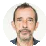
In het volgende nummer kiest FILIP CLAUS een favoriete foto.

Bij een opname zijn er twee belangrijke afwegingen die een fotograaf maakt: de plek waar hij gaat staan, en het moment waarop hij afdrukt. Als alles goed gaat, kan er magie ontstaan. Dat heeft meer met vakmanschap te maken dan met toeval.