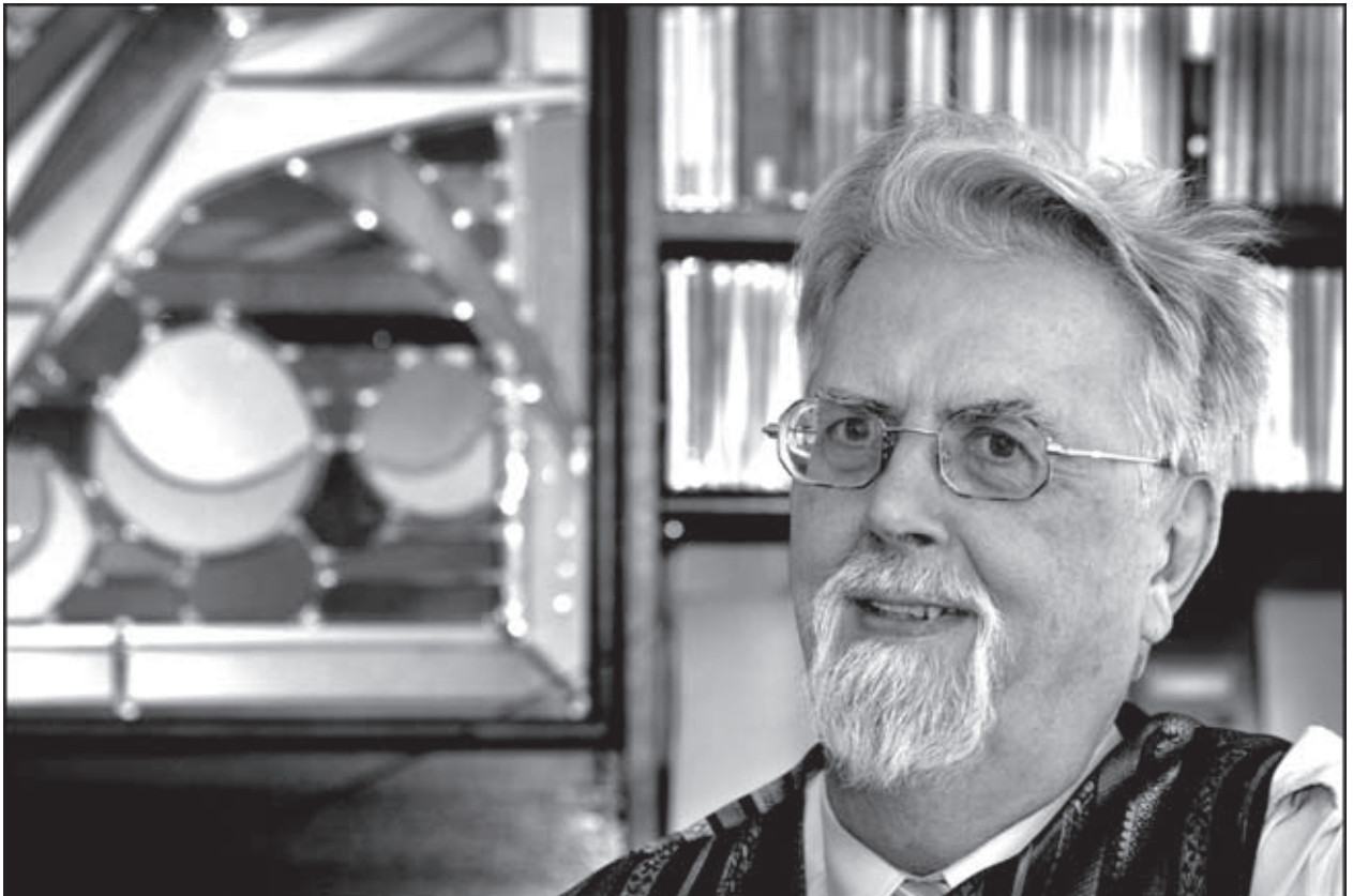
“De harde interviewer is niet altijd degene die het meest bovenspit.”

es staan bestsellers als De keien van de Wetstraat , Sire geef me honderd dagen , Omtrent Wilfried Martens , “Ben ik alleen maar de man die de schijnwerper bedient opdat bepaalde mensen goed in het licht staan?”