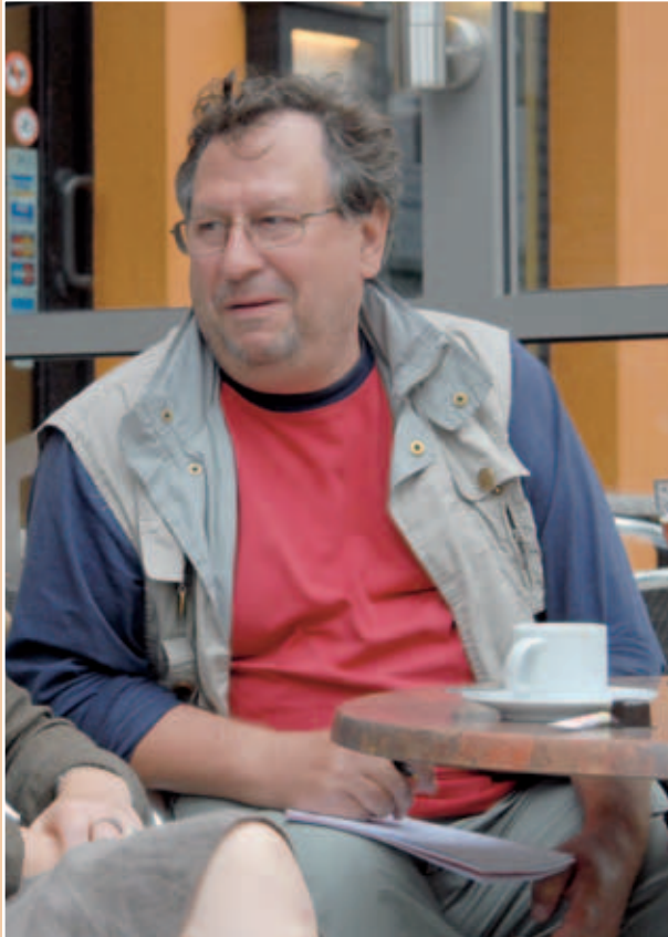
‘Het internet kweekt luie donders, die niet meer buitengaan om nieuws te zoeken.’

Doorslaer, die jobstudent-soi-rist bij Vooruit was. Die krant zocht een medewerker voor popmuziek: ‘t werd mijn opstapje naar de journalistiek.”