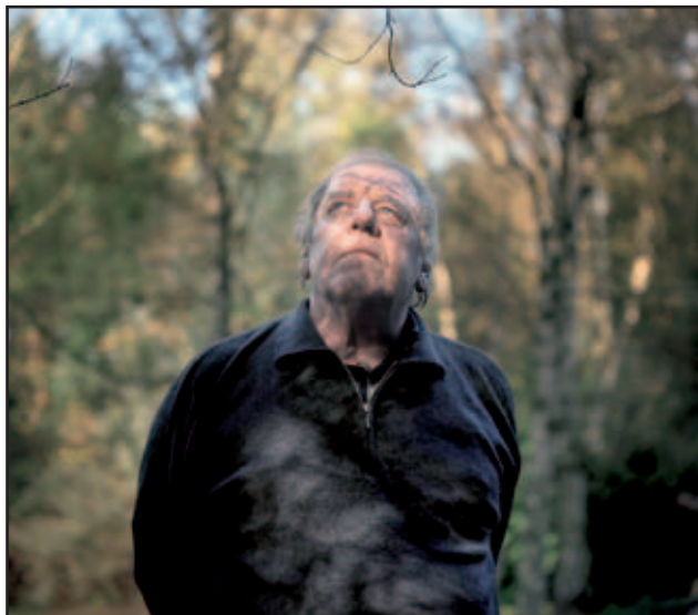
JEROEN BROUWERS