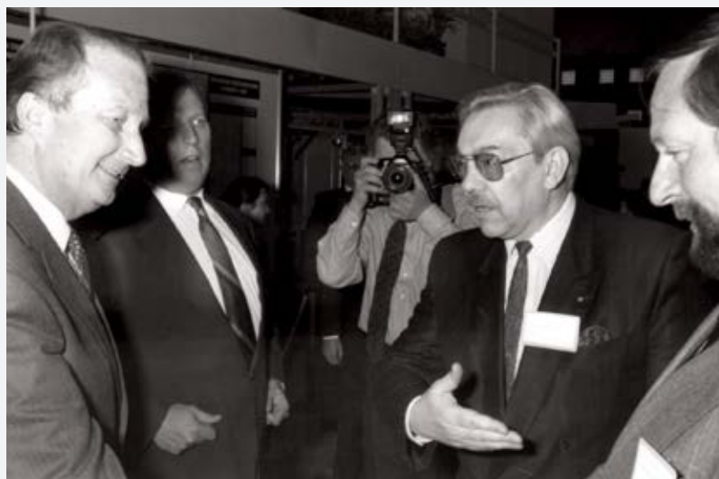
Met toen nog prins Albert.