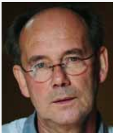
'Een wijze raad aan alle journalisten: neem een verzekering voor beroepsaansprakelijkheid.'

"Journalistiek is gedrevenheid. En nieuwsgierigheid. Je moet de