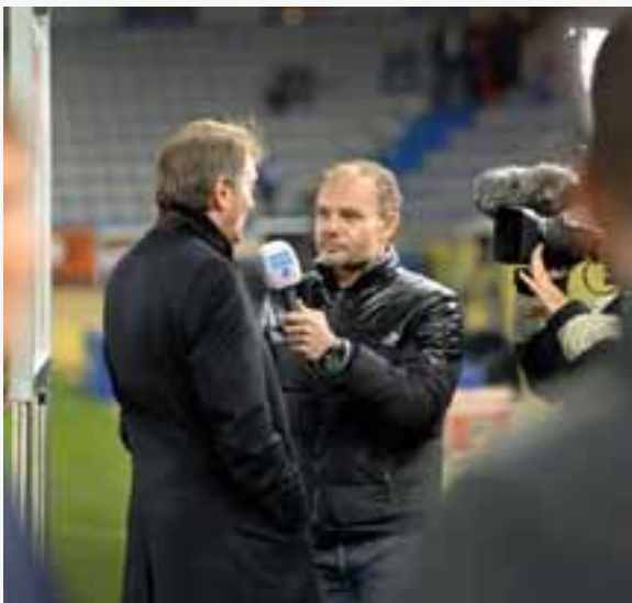
Sportspress.be en de AVBB aanvaarden niet dat moet worden betaald voor interviews gerealiseerd door andere omroepen.

Om het recht om te informeren te vrijwaren, is AIPS Europe (de Europese Sportpersbond) in oktober met een verzoekschrift naar het Europees Parlement getrokken. Steeds vaker moeten audiovisuele media betalen voor een accreditatie in het voetbal of het wielrennen. De commissie Verzoekschriften vond deze ontwikkeling belangwekkend genoeg om ze voor verder onderzoek door te verwijzen naar drie andere parlementaire commissies: Interne markt en consumentenbescherming (IMCO), Cultuur en onderwijs (CULT) en Burgerlijke vrijheden, justitie en binnenlandse zaken (LIBE). Wordt dus vervolgd.