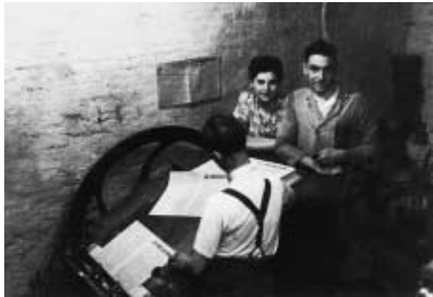
Clandestiene drukkerij in Luik

Als eerste krant wordt beschouwd het nieuwsblad dat Verhoeven verspreidde na de slag van Ekeren op 17 mei 1605. Daar vocht het leger der Nederlandse Provinciën tegen de Spaanse troepen. Over die veldslag berichtte Verhoeven in zijn eerste krantje met tekst en tekening. Fotografie bestond dan wel nog niet in 1605, een krant