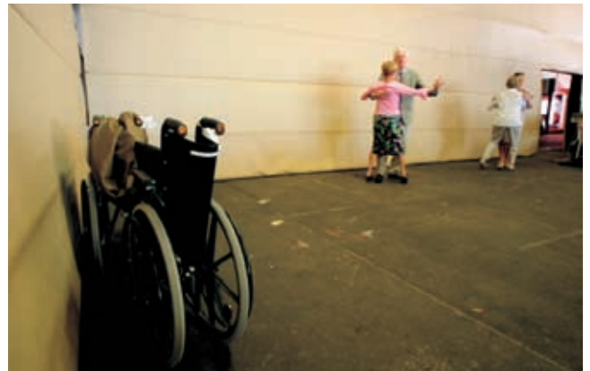
De Vlaamse uitgevers zijn na een uitstekend 2003 ook optimistisch over de resultaten in 2004. (Met deze foto won Bruno Fahy de SABAM-prijs voor 2de beste humoristische persfoto in 2003)

strijd geleverd om de radioluisteraar. Niet alleen traden er met de pas vergunde provincie- en lokale radio's een pak nieuwe challengers in het strijdperk, daarenboven knabbelen ook de grote commerciële omroepen steeds harder aan het radiomonopolie dat de VRT tot dusver in de feiten had. Q-Music (VMMa), 4FM, Radio Contact en Topradio dienden tegen de openbare omroep zelfs klacht in bij de Europese Commissie voor de dumpingprijzen die deze zou hanteren voor haar radioreclame.