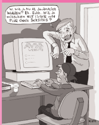
Cartoon van Kim Duchateau.